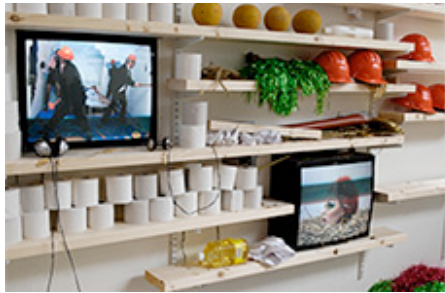
(utsnitt) © Vera Sjunnesson