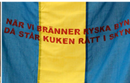
(detalj) © Oscar Guermouche

Bland femårseleverna sticker Oscar Guermouche ut och använder flaggan i egenskap av symbol för den anonyma makten. I röda texter över blågult skanderas rysshät som mobiliserar, människor fiendegörs som byten för lovligt skändande. Allt uttalas i gott syfte för vårt gemensamma försvar. Gestaltningen är effektiv och fungerar självständigt utan ledsagande projektbeskrivning.